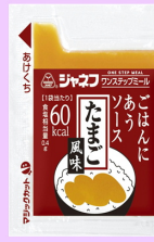
●ごはんにあうソース たまご風味

手軽にたまごかけごはんの風味を味わうことができます。1袋60kcal補給できます。