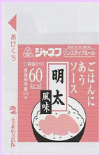
●ごはんにあうソース 明太風味