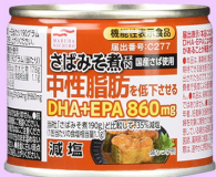
●減塩さばみそ煮N 中性脂肪を低下させる